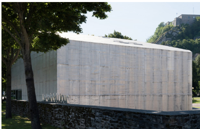
Le Point du Jour, février 2018