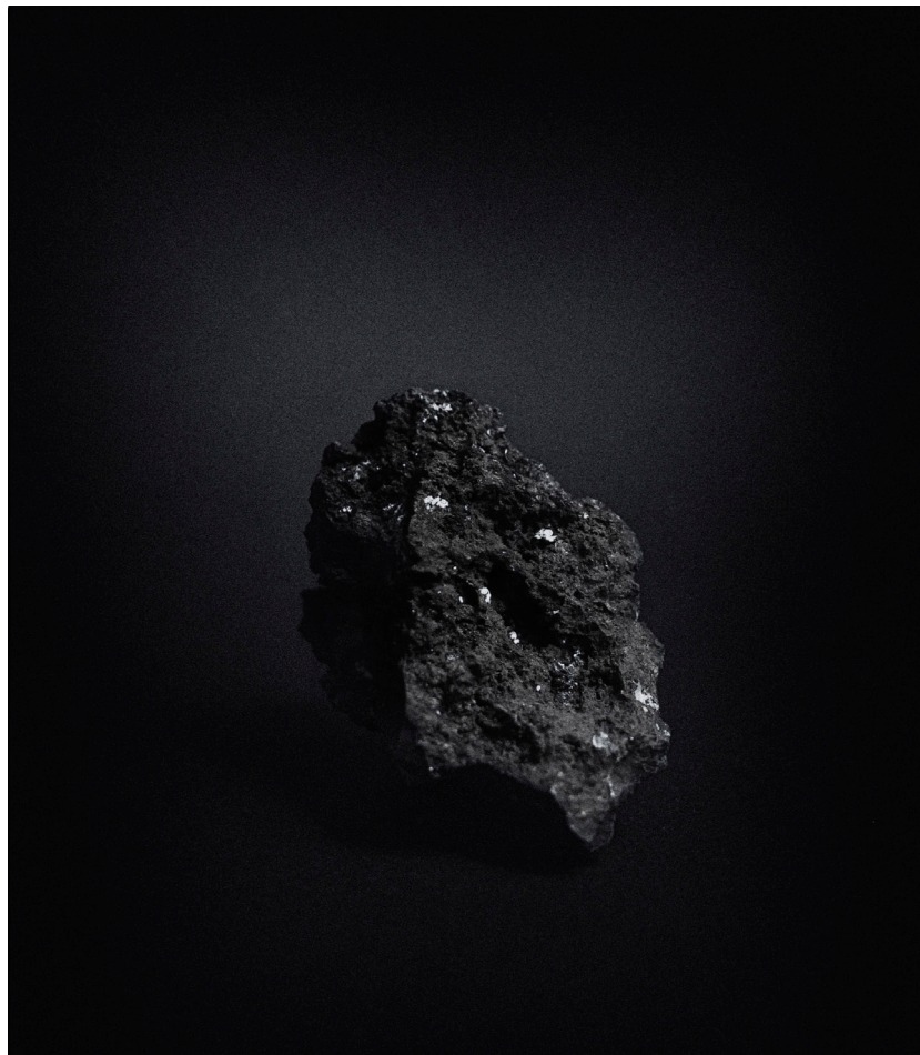
Coline Jourdan, Roche arseniée, 2020. Extrait du projet Soulever la poussière