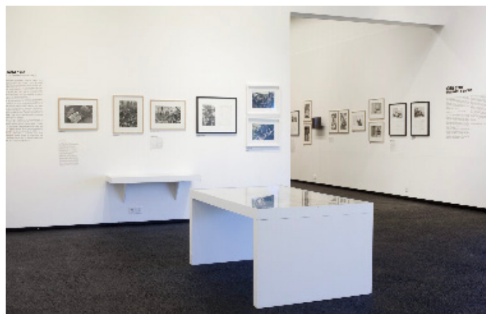
Vue de l'exposition Gilles Caron. Un monde imparfait , juin - octobre 2021