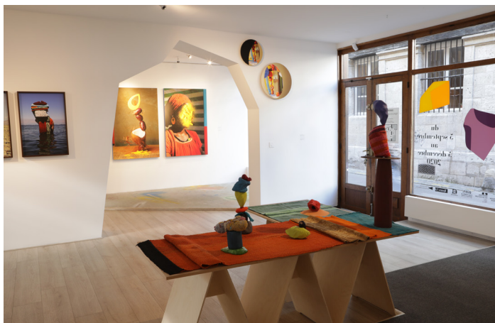
Vue de l'exposition Lorenzo Vitturi, Nulla è puro , septembre 2020 - janvier 2021